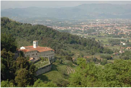
Convento di San Cerbone (Lucca)